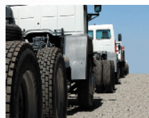
Modificación de Camiones