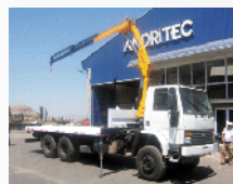
Grúas Articuladas Sobre Camión