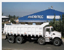
Tolvas Sobre Camión