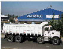
Tolvas Sobre Camión