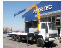
Grúas Articuladas Sobre Camión